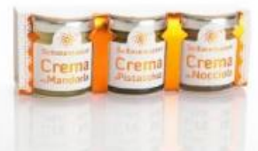
DolceTrio-Cremes (Pistazie – Mandel – Haselnuss)