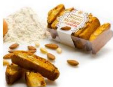
Sizilianische Cantucci mit Mandeln

Karton á 36x100g per Packung € 3,80 Art.Nr. 80079