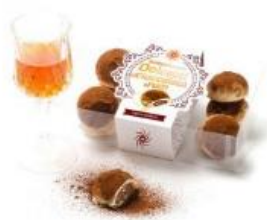
Modica-Schokoladen- und Rumbonbons