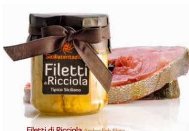
Filetti di Ricciola Amber Fish Filets

Preise exkl. Mwst gültig ab 1.2.2025, Änderungen vorbehalten