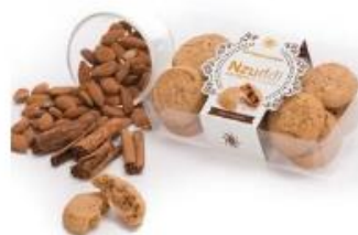
Nzuddi mit Mandeln und Zimt