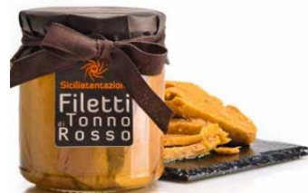
Filetti di Tonno rosso Red Tuna Filets