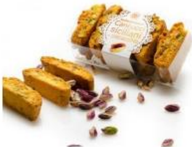
Sizilianische Cantucci mit Pistazien

Karton á 20x240g per Packung € 7,90 Art.Nr. 80078