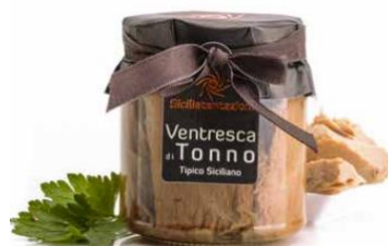
Ventresca di Tonno Tuna Ventresca