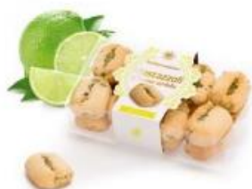
Mustazzoli mit grüner Zitrone